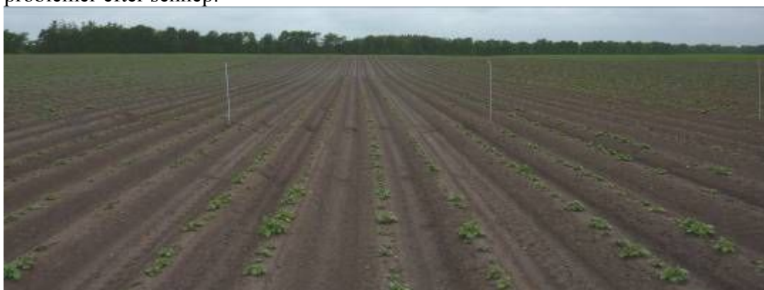
Foto 3. Fremspiringsproblemer efter sennep juni 2010.

I foråret efter at kartoflerne er spiret frem, blev det hurtigt tydeligt, at i forsøget med tidlig etablering, var der sket noget i parcellerne med sennep (se foto 3 ). I alle gentagelser i marken spirede kartoflerne her meget dårligt frem og afgrøden kom aldrig til at se normal ud. Alle forsøgene blev screenet for rodtiltsvamp og nematodesugninger på stænglerne, men ingen af de øvrige steder så vi de samme problemer efter sennep.