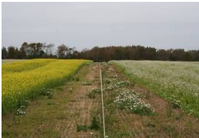
Foto 1. Sennep og ræddike etableret 29. juli 2009.