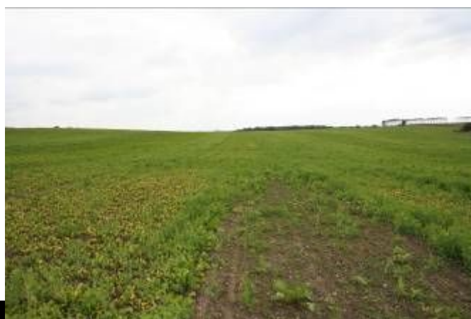
Foto 2. Sennep og ræddike etableret 18. august 2009.

I foråret efter at kartoflerne er spiret frem, blev det hurtigt tydeligt, at i forsøget med tidlig etablering, var der sket noget i parcellerne med sennep (se foto 3 ). I alle gentagelser i marken spirede kartoflerne her meget dårligt frem og afgrøden kom aldrig til at se normal ud. Alle forsøgene blev screenet for rodtiltsvamp og nematodesugninger på stænglerne, men ingen af de øvrige steder så vi de samme problemer efter sennep.